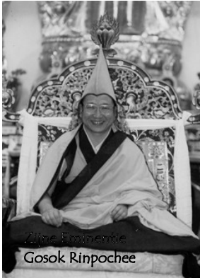
Zijne Eminentie Gosok Rinpochee

worden gevraagd, per lezing, om zo de kosten te verrekenen. Er zal voor deze gelegenheid een aparte bankrekening worden geopend. Tot slot en heel belangrijk indien er vrijwilligers zijn die willen helpen, zeer welkom, willen deze dat kenbaar maken door ons te bellen of per email.