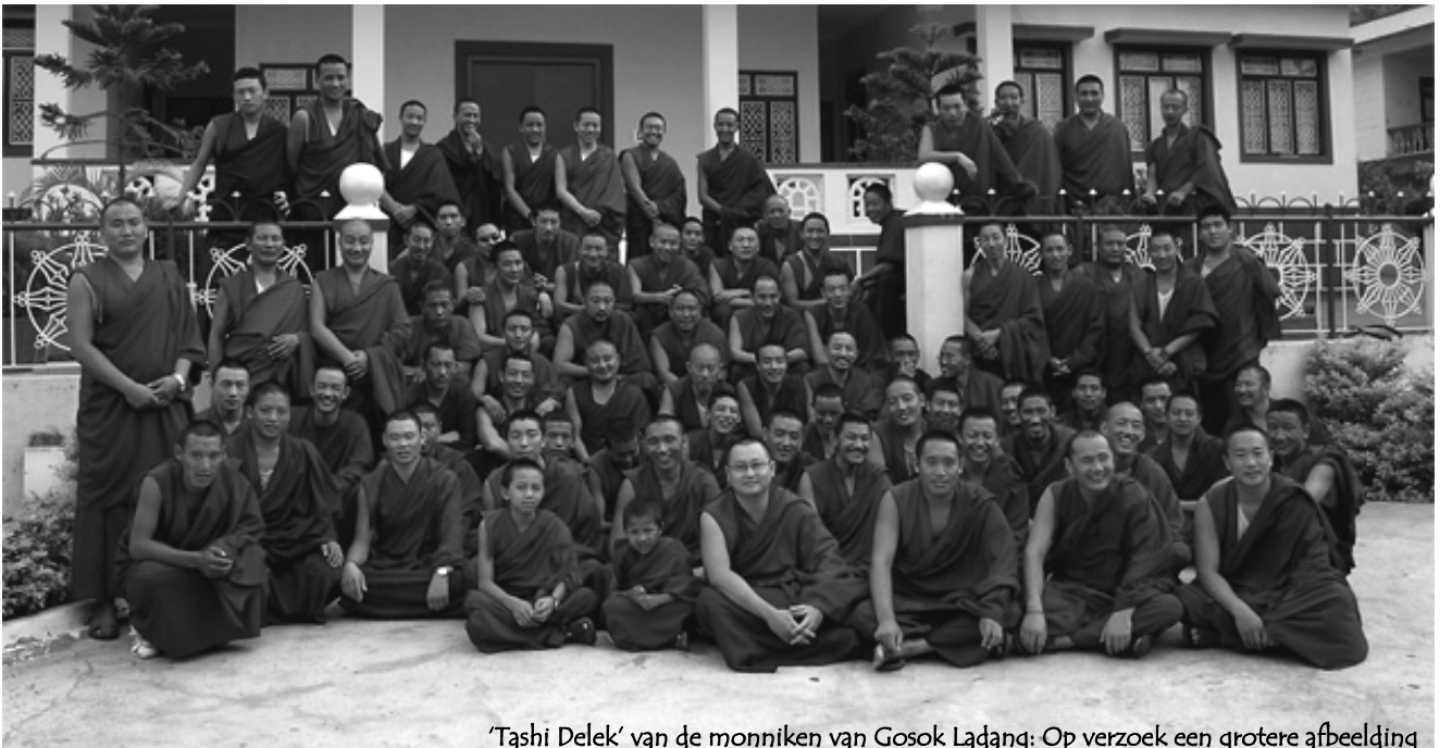
'Tashi Delek' van de monniken van Gosok Ladang: Op verzoek een grotere afbeelding