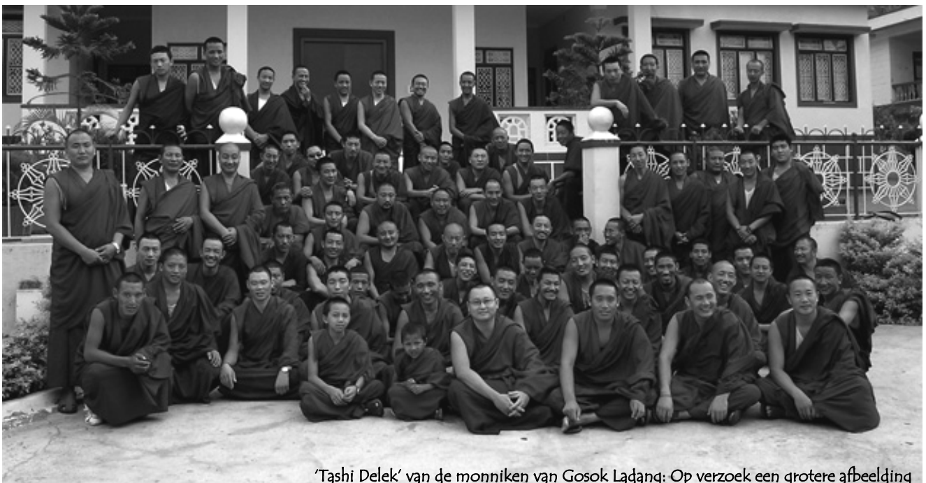
'Tashi Delek' van de monniken van Gosok Ladang: Op verzoek een grotere afbeelding