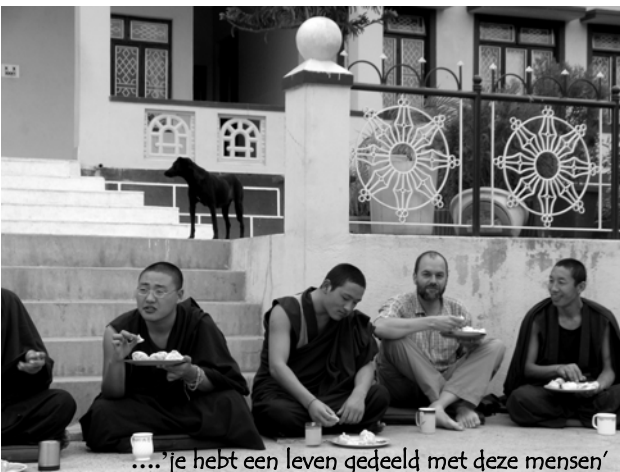
... 'je hebt een leven gedeeld met deze mensen'