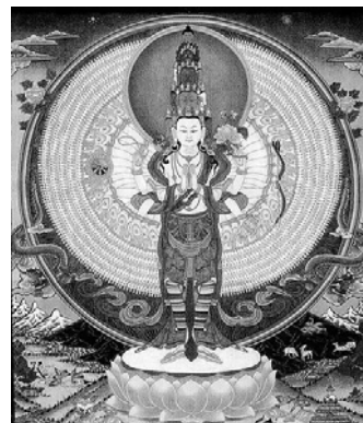
voorbeeld: 1000 armen

opstanden zijn ontstaan tegen de chinese overheersing.